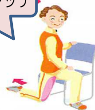
太もも前のストレッチ