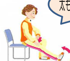
太もも裏のストレッチ