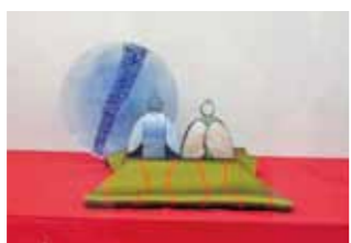
▲ガラス雑(昨年出品例)

企画展 創作雑と古今雑 ガラス、陶芸、ちりめん細工など多彩な創作雑の数々と伝統の香り漂う古今雑を展示。