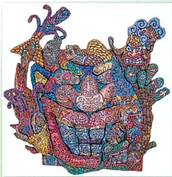
おまつ・T《インチキ魔術師の妄想》 2016年収蔵