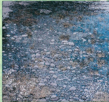
仁木 勉《川原》 2008年収蔵