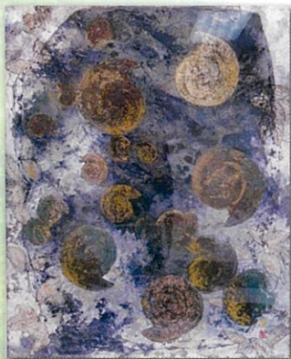
青田賢蔵《太古の海》 2012年収蔵