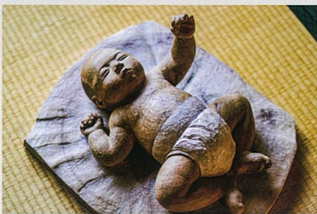
むすんでひらいて