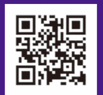
▶ホームページはこちら