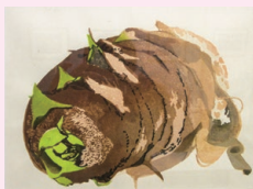
真鏡影一 菊(昨年出品)

アート・フェス公募展で入賞を重ねるなどの実績をもち、三木の刃物を使用する複数の木版画作家の作品を展示。