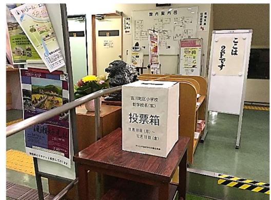
吉川町公民館に設置した投票箱