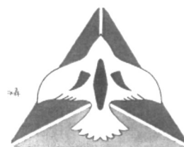
みなぎ台小学校章