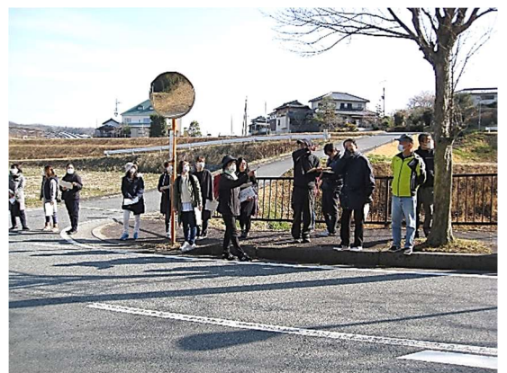
通学路の安全確認の様子