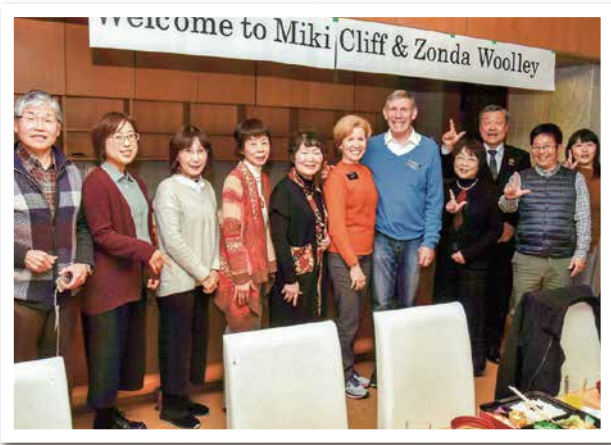
2019年1月の歓迎会にて