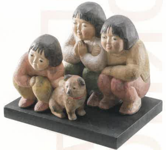
「記念写真(犬の来た日)／松田 京子」

「公募展木彫フォークアートおおや」は、プロアマ問わず全国から毎年100点以上の作品が集まります。