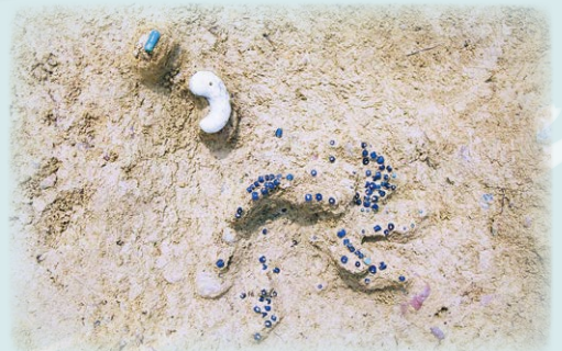
棺内玉類出土状況 (高木28号墳)