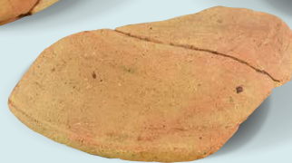
経筒・外容器 (王子神社経塚)