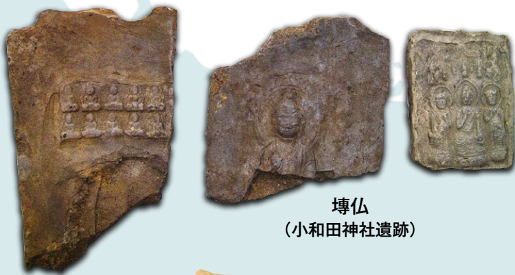
埴仏 (小和田神社遺跡)