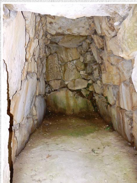
正法寺1号墳 石室内

三木市別所町には、約300か所の遺跡が確認されています。 これまでに多くの遺跡で発掘調査が実施されてきましたが、その成果を公開する機会が限られていたため、内容についてはあまり知られていません。 そこで、このたび、別所町の遺跡を広く知っていただくため、本展を企画しました。 本展では、別所町で実施された遺跡の発掘調査成果について、出土遺物や写真パネルを通して、別所町の歴史を紹介します。