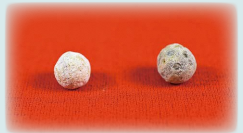
鉄砲玉 (左・小林八幡神社付城跡 右・高木大塚土塁)