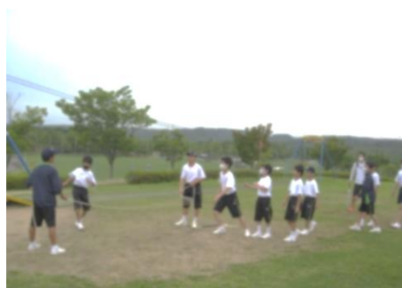
1年生の交流の様子（総合防災公園）