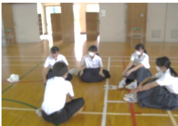
2年生の交流の様子（緑が丘中学校）

10月には、緑が丘中学校の教室で、志染中学校及び緑が丘中学校の生徒と一緒に学ぶ合同授業が計画されています。