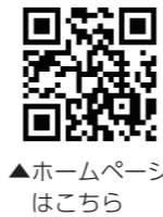
▲ホームページはこちら

問(市)縁結び課 縁結び係 http://www.miki-akiyabank.com