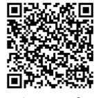
▲ホームページはこちら