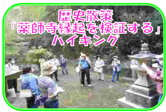
「身近な地域の歴史をみんなで学習しよう！」を合言葉に、毎年、町内の歴史散策を実施しています。