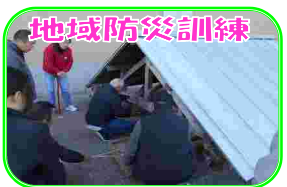
県立広域防災センターで簡易救出器具を使った救出を行ったり、ロープ結束訓練など、実践的な訓練を行います。