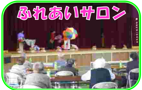
コロナウイルス感染症防止対策のため、中止していましたがふれあいサロンも10月から再開されました。毎月第3火曜日に開催しています。