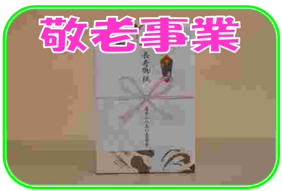
今年度は、コロナウイルス感染症防止対策のため残念ながら敬老会が実施できませんでした。地域の75歳以上の方に長寿お祝いの記念品を贈呈させていただきました。