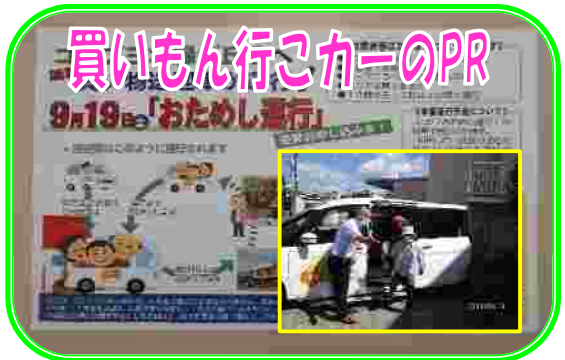
実施したアンケートの中で、移動手段がないために買い物に困っている方が多くいらっしゃいました。そこで、コープこうべさんが実施している無料買い物送迎車「買い物行こカー」事業についてPR活動を実施しました。