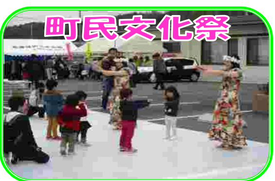
毎年3月第1日曜日に、1年間の成果の発表として文化祭を開催し、交流と親睦を図りながら楽しく1日を過ごしています。