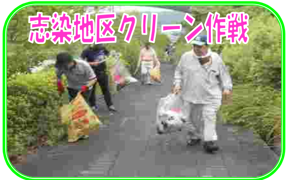
今年度も、沿道を散歩される方等が気持ちよく歩いていたできるように志染地区クリーン作戦を実施します。