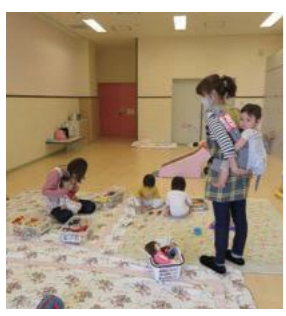
育を行っています。理由は問いませんので、気軽に利用してください。 問(市)子育て支援課 子育て応援係

児童センターでは、忙しいママやパパがリフレッシュできるよう、生後6カ月から就学前までの乳幼児を対象とした一時預かり保