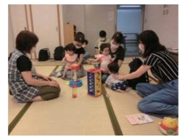
とを話しに来ませんか？ 問(市)健康増進課 母子保健係

赤ちゃんを遊ばせながら、助産師・保健師・保育士に産前・産後の不安や悩みを相談でき、ママ・パパ同士の交流もできる場です(妊娠中の方も参加可)。赤ちゃんの体重測定をしたり、一緒に成長を確認したりするなど、日々頑張っている子育てのこ