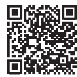
▲上下水道料金はこちら