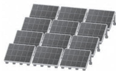
☎ (市)税務課 資産税係