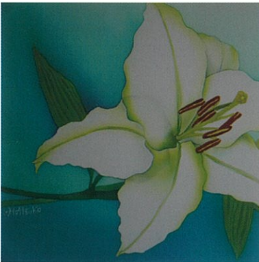
-友からの贈物- 風香の便り