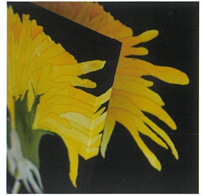
-散歩道- 春のめざめ