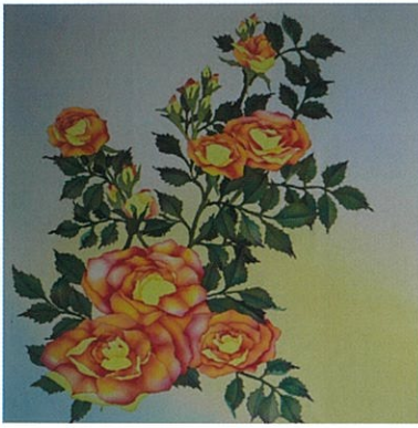
-離宮公園にて- 微笑返し