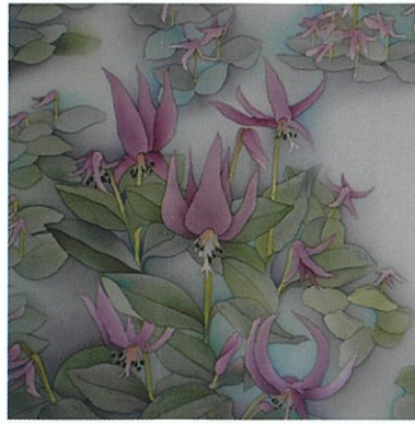
-三木・伽耶院にて- 春の妖精