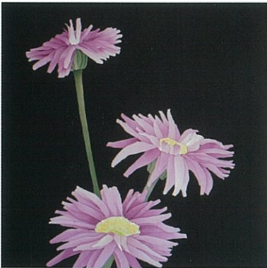
-花ことば- 思いやり