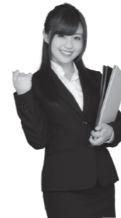
ホームページはこちら▶