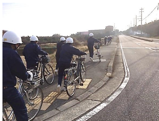
自転車通学練習の様子(12月23日)