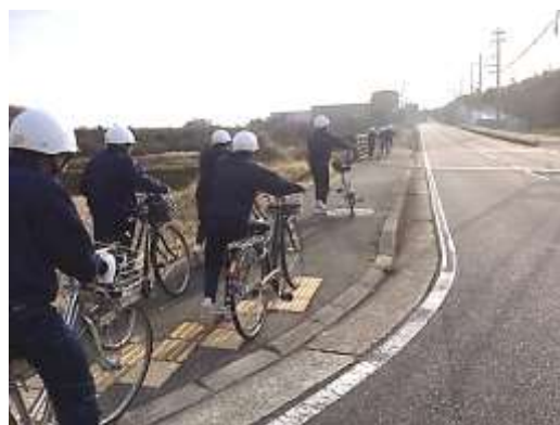
自転車通学練習の様子(12月23日)