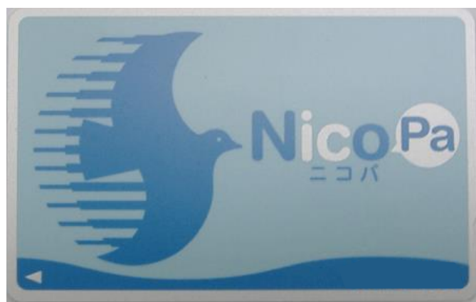
ニコパカード(原寸大) (実物の色彩とは多少異なります)

このカードを利用することにより、正規運賃と一律運賃との差額の算出に必要なバス利用者の乗車区間を正確に把握することができます。