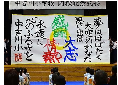
書道パフォーマンスの様子 中吉川小学校 閉校記念式典