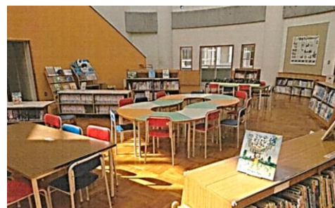
第2図書室として活用するコモンホールの様子