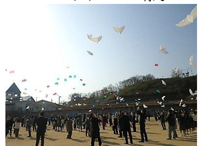
バルーンリリースの様子