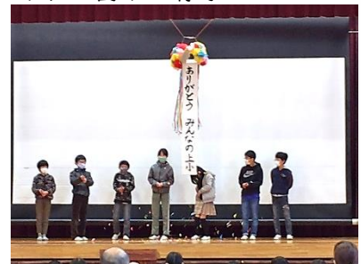
くす玉割りの様子