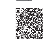
▲詳細は消防庁ホームページで確認ください