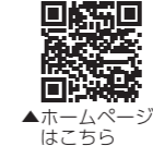
▲ホームページはこちら