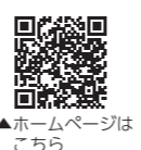
▲ホームページはこちら

内 3名とプロゴルファー1名でのラウンド(スクランブル方式) 期 4月5日(月)～16日(金) 費 30,000円/組(参加費込み、昼食付) 申 定先 3組(9名) 参加対象の詳細は問い合わせてください。 問(市)ゴルフのまち推進課 ☎89-2401