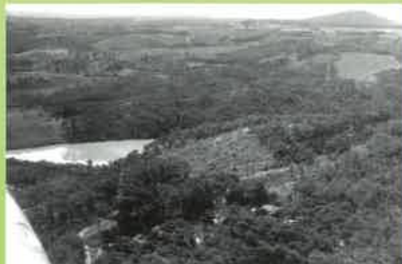
（写真左）志染町吉田上空より南（現自由が丘付近）を望む（画面下の谷田は現在三木山陽病院敷地）