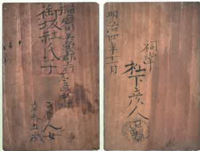
氏子札(左・表、右・裏)

それ以前の江戸時代には、寺が村人の身分を保証する寺請制度がありました。江戸幕府のキリスト教弾圧政策に関連して、キリシタンではないことを保証するとともに、寺は周辺の人々を檀家として把握することになりました。この寺請制度は、寛永12年(1635)頃から始まり、寛永15年頃には全国的に成立していたとみられています。またその後、寺請制度に合わせて各村単位の「宗門人別改帳」を作成す