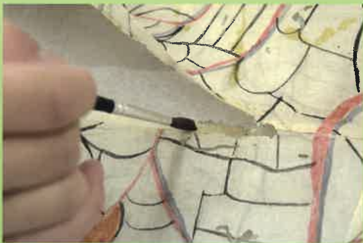
継ぎ目はがれの修復。水で薄めた「でんぶんのり」で

三木市史編さん室では、虫食い穴あきになった資料や、絵具がはがれた資料、紙の継ぎ目がはなれ