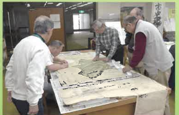
村絵図の修復 (2019年3月28日撮影)

開催日時：毎週水・木曜（どちらか1日の参加でもOK） 13:00～15:00（※新型コロナウイルス感染予防のため活動時間を短縮中）／場所：みき歴史資料館2階市史編さん室 ボランティアの活動内容：①デジタルカメラでの古文書の写真撮影、②江戸時代以降の崩した文字（崩し字）の解読、③資料の修復（しわのぼし・糊づけ等）、④新聞検索（各社新聞から三木に関する記事を選別する）。