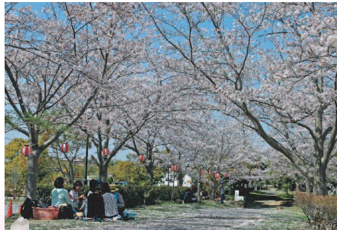
▲協同学苑 (志染町青山)