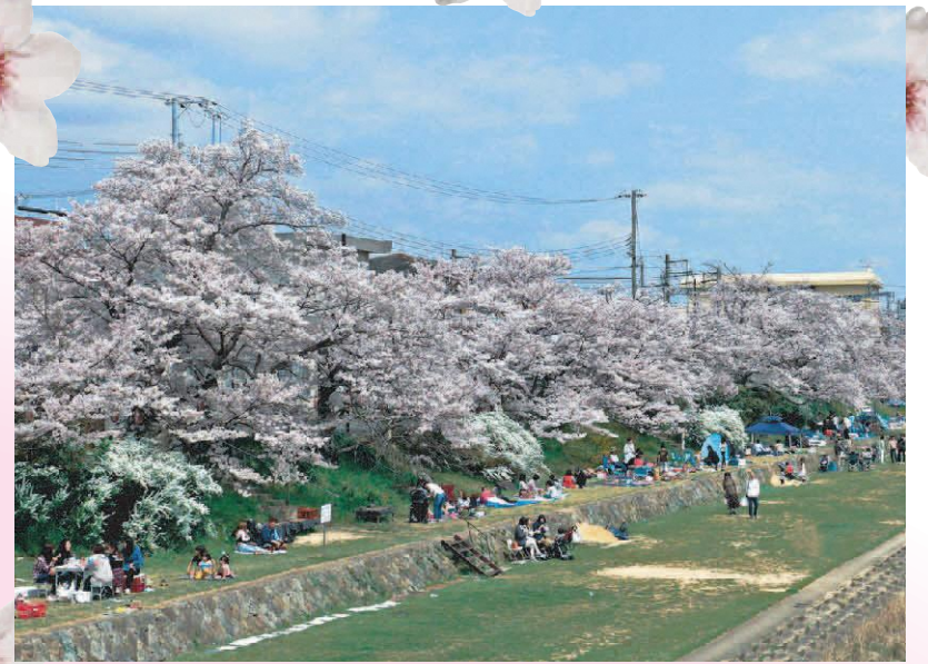
▲美囊川リバーサイドパーク (末広)