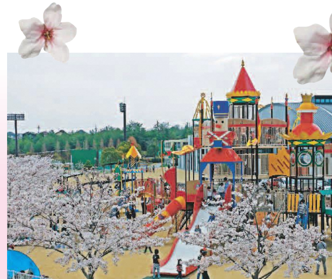
▲みきっこランド (福井)