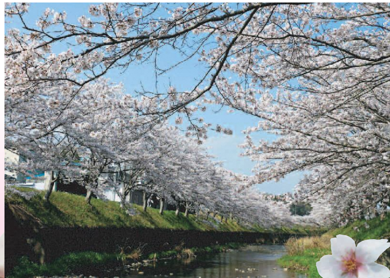
▲北谷川 (吉川町古川)