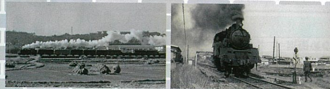
当時の日本は戦争中で、兵隊さんや戦争に必要なもの運ぶためなどの理由で国に移管。