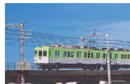
▲1950～1960年代風に塗装されたメモリアルトレイン