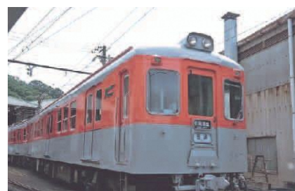
▲1960～1980年代風に塗装されたメモリアルトレイン