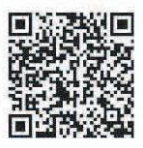
ホームページはこちら

より透明性のある行政を進めるため、市の正規職員・非常勤職員(嘱託職員・アルバイト職員)の給与や人数などについての状況を公表します。 詳細については市ホームページをご覧ください。