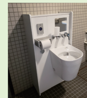
オストメイト対応トイレ

支所を統合することに伴い、駐車場を安全に利用していただくため、駐車場の改修を行い、フェンスを設置しました。また、障がい者用トイレにオストメイト対応トイレ※を設置しました。