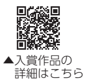
▲ 入賞作品の詳細はこちら