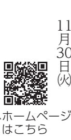
▲ ホームページはこちら