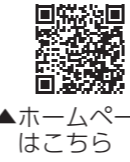
▲ ホームページはこちら