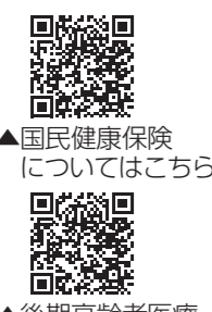
▲ 国民健康保険についてはこちら

事前に電話で相談した上で、市ホームページにある申請書や必要書類を窓口または郵送で提出してください。