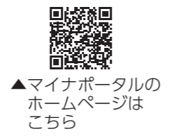
▲ マイナポータルホームページはこちら