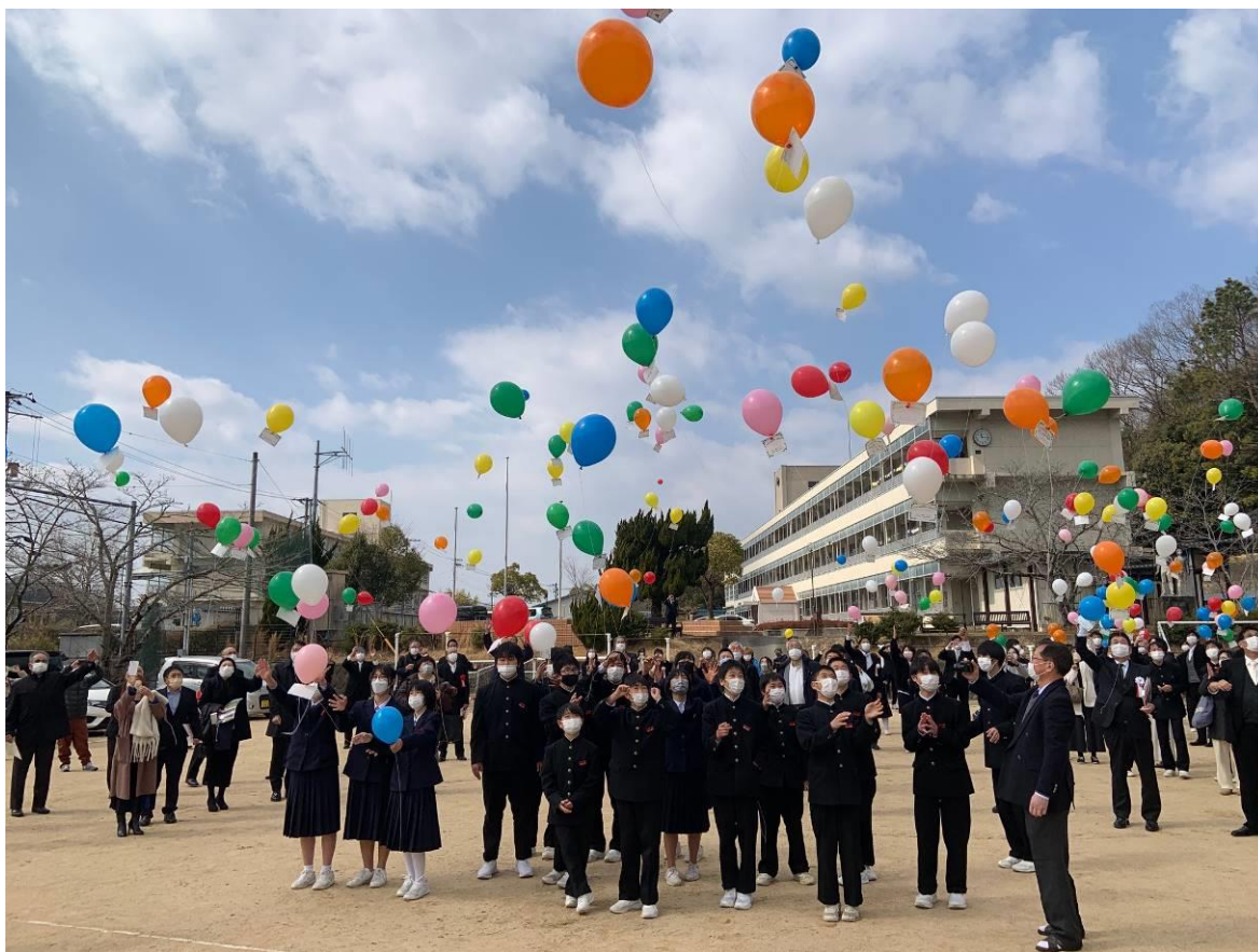
星陽中学校閉校記念式典 閉校記念イベント「バルーンリリース」 2/27