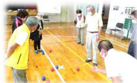
【10/8 高齢者 ニュースポーツ体験】