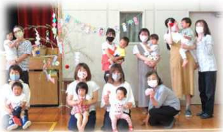
【6/24 開級式・七夕飾り作り】