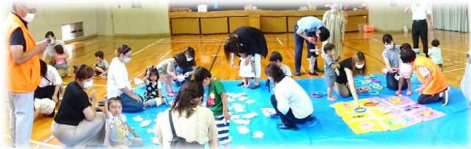
【7/15 市老連若手委員会を招いて縁日ごっこ】