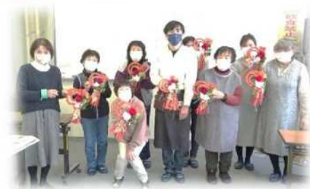
【12/9 ゆとり 正月飾り作り】