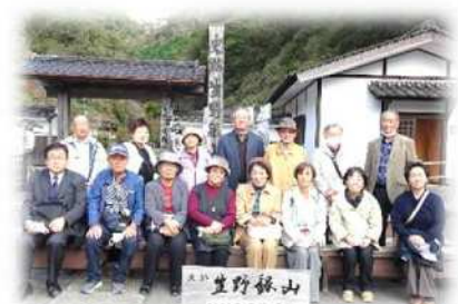
【ゆとり・高齢者合同館外研修】

「ゆとり講座」・「高齢者教室」どちらの講座も、健康・歴史・人権・ものづくり・館外研修等の内容を予定しています。講座内容については、その都度、全戸配布の募集チラシにてご案内いたします。お友達とお誘い合わせのうえ、お気軽にご参加ください。