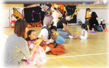
【10/8 ハロウィンを楽しもう】