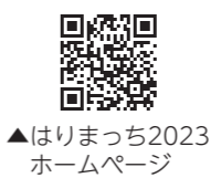
▲はりまっち2023 ホームページ

▼場所 バーチャル合同就職説明会会場(はりまっち特設サイト上) ▼対象 大学、短期大学、高等専門学校、専門学校などを令和5年3