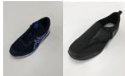
センサーシューズ