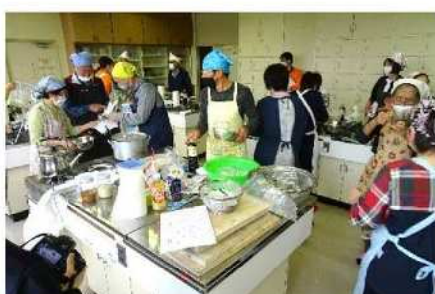
<山田錦の麴で、町おこしをしよう>