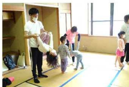
<親子ふれあいヨガ>