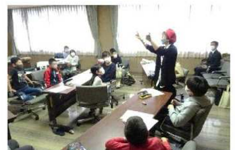
<お絵描きしたいこども達、集まれ〜>