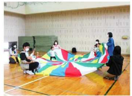
<パラバルーンあそび>