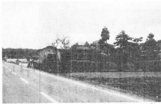
▲ 庄屋屋敷 離れ屋敷（吉野さん宅）

ことです。我々現代人は、もっとももっともこうした事に深い関心と理解を有するべきではない。 文・信国 清