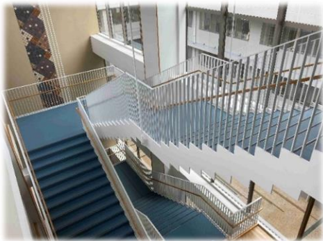
階段ごとに色分けし、どこにある階段かを分かりやすくしています。