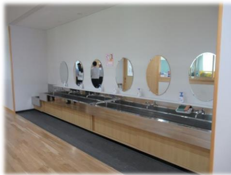
手洗い場は、発達に合わせ、階により高さを変えています。