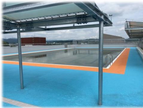
水が汚れにくく、外から見えにくい屋上設置の大・小プールです。