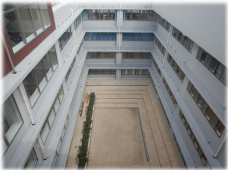
つながりのにわ(中庭)では小・中学生が集い、多くの目で見守ります。