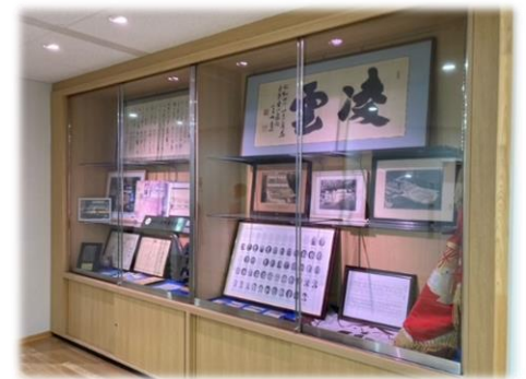
1中2小の歴史を展示するメモリアル展示スペースです。