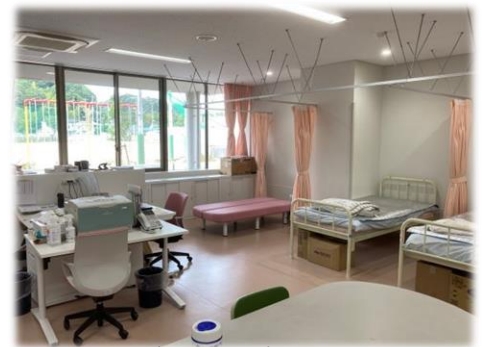
小・中で2人の養護教諭が保健室で温かく見守ります。