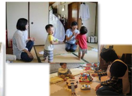
育児支援のイメージ