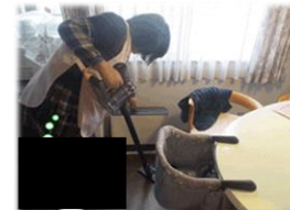
家事支援のイメージ