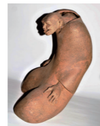
▲寸景の記録 作品名：久しぶり

さんさんギャラリーオアシスは、令和5年2月末に閉鎖します。閉鎖後の作品展示は市立公民館のロビー、市役所みつきいホールなどで行われます。