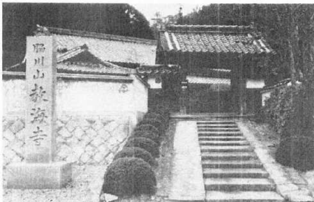
脇川教海寺凱旋門

ここはお国の何百里 離れて遠き満州の 赤い夕日に照らされて 友は野末の石の下 文・信国 清