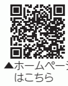
▲ホームページはこちら