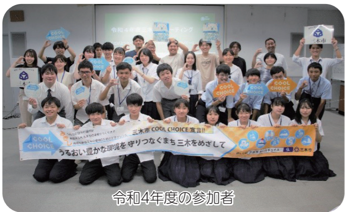
令和4年度の参加者