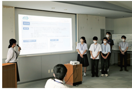
まとめた内容をグループ全員で発表する