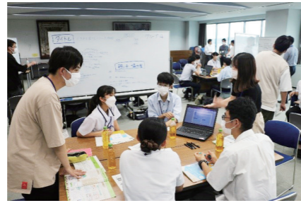
各グループに分かれ、意見交換を行い、まとめていく

6つのグループに分かれ、大学生が進行役になり、若者に対するクールチョイスのPR方法について積極的に意見交換を行いました。最後には、グループごとに参加者や市長の前で発表を行いました。