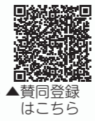
▲賛同登録はこちら

市の取り組みやイベント情報など、クールチョイスの情報をホームページで紹介しています。