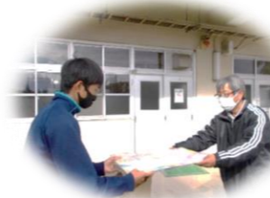
文化祭ポスター返却(吉川小・吉川中)

3日間という短い期間でしたが、笑顔で来館者に対応し、明るく積極的に仕事に取り組んでいただき、将来にきっと役立つ経験となったと思います。お疲れさまでした。