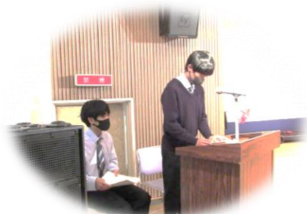
吉川高校の学生による司会

公民館の外ではポップコーン・綿菓子の無料配布、まほろばパン・彩雲・あすなろ・みによんちのバザーが開催されました。図書館に併設する、よかところでもコーヒーくらのコーヒー販売を行い多数の来館者で賑わいました。ご来場いただいた皆さま、運営・準備にご協力いただいた皆さま、本当にありがとうございました。