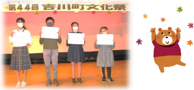
ポスター展入賞おめでとうございます!