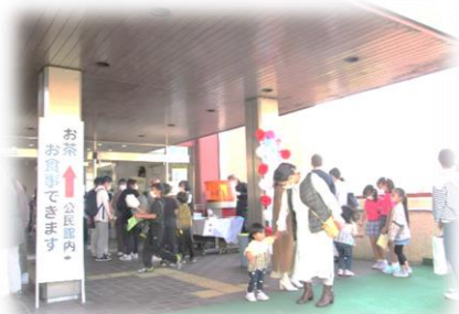
ポップコーン無料配布