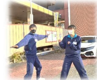
元気いっぱい2人です!!