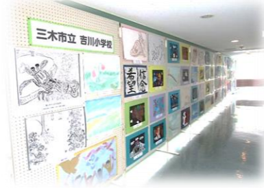
吉川小学校の作品展