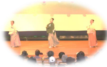
青柳流詩舞による芸能発表