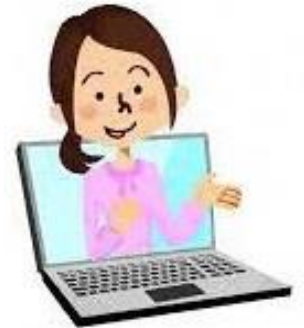
(図2) 困った時の“3つのステップ”

文部科学省の「令和元年度児童生徒の問題行動等調査結果」によると、いじめを受けた児童生徒の相談先は、「学級担任に相談」80.8%、「保護者や家族等に相談」21.6%、「学級担任以外の教職員に相談」7.4%、「友人に相談」6.6%という結果でした。(複数回答) やはり学校の役割は大きいです。子どもが安心していつでも相談できる環境を整えておくことはとても大切です。私たちの周りの大人が、子どもたちを受け入れ、関心を持って見守る環境を構築することが、いじめやトラブルを無くすために何より大切なことではないかと考えています。