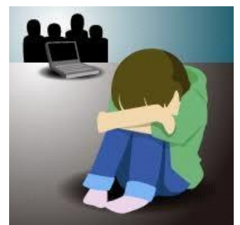
(図1) ネットいじめ、トラブルのサイン