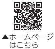
▲ホームページはこちら

●注意事項 カードの申請・交付以外の手続きは行えません。 問(市)市民課 市民係