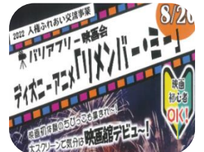
★バリアフリー映画