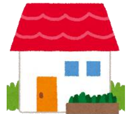
いっこだ 一戸建て