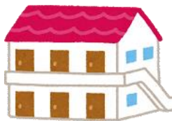
あばーと アパート