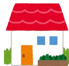
Nhà nguyên căn