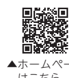
▲ホームページはこちら