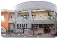
神和認定こども園